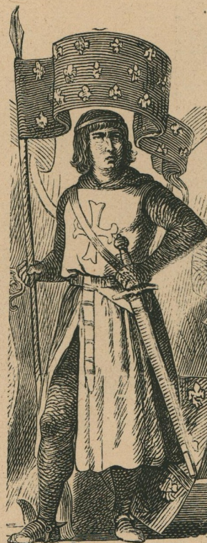
74. — Un chevalier croisé. Een kruisridder.