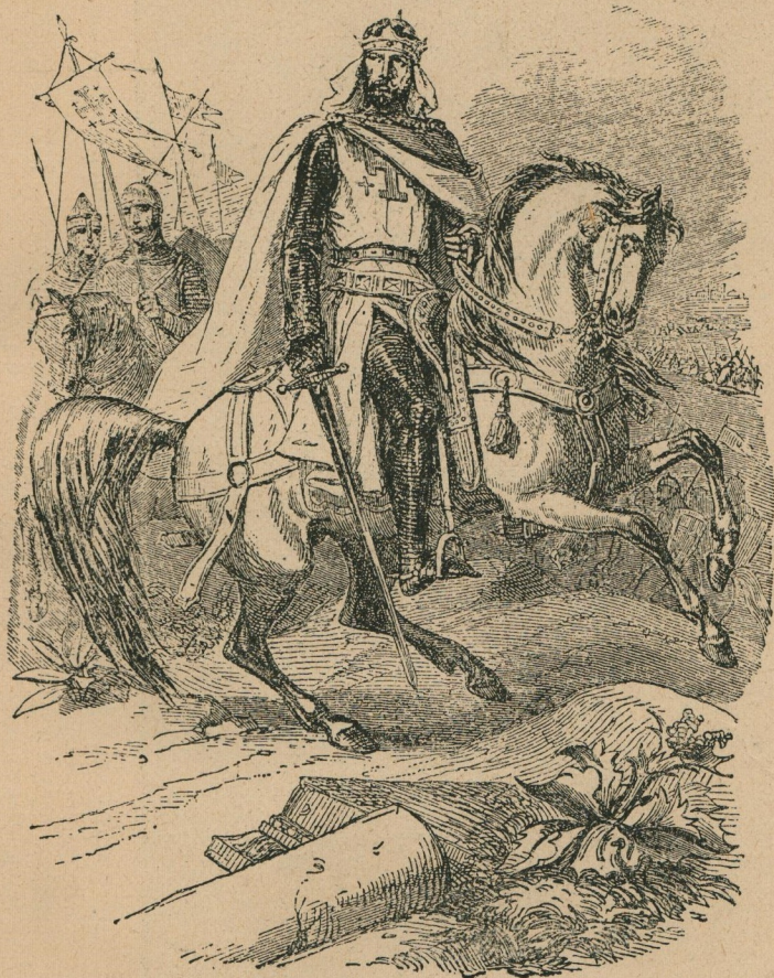
73. — Godefroid de Bouillon, chef de la première croisade. Godfried van Bouillon, opperhoofd van den eersten kruistocht.